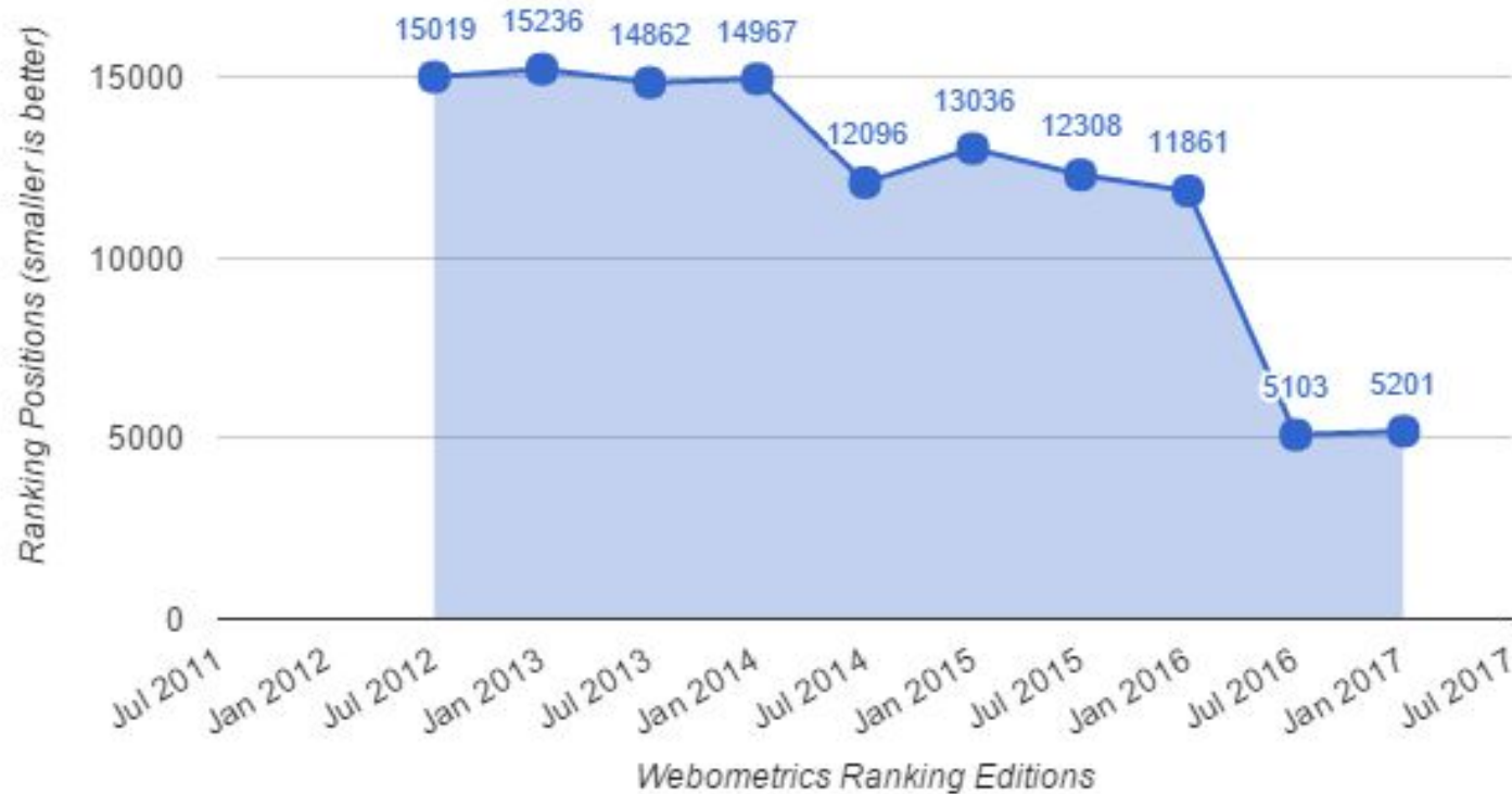
Koya University Historical Ranking Trends