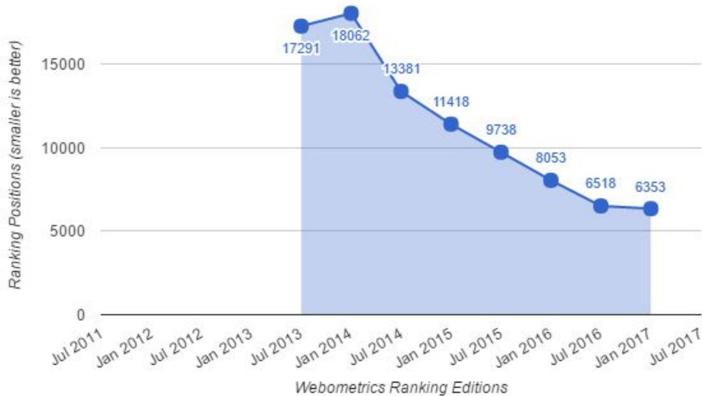
Soran University Historical Ranking Trends